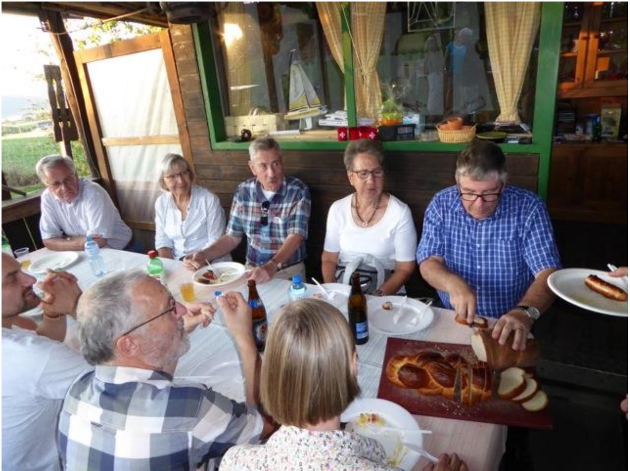
Bilder: Ernesto Seiler, G. Bauersachs, Text: Gertrud Bauersachs